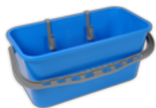
1 Eimer inkl. Kunststoffhaken