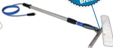
Teleskopstange 0,6-1,2 m